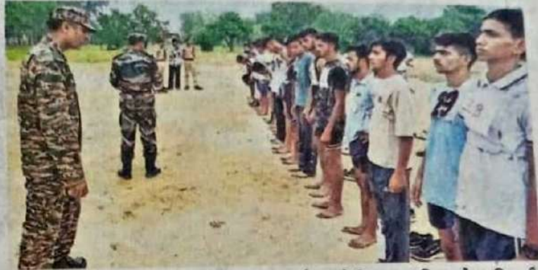
भट्टकलां कॉलेज में एन.सी.सी. कैडेट्स का चयन करते हिसार बटालियन के अधिकारी।